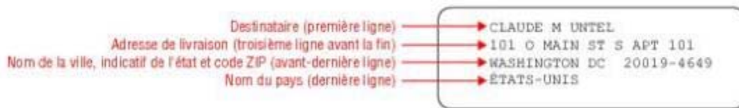
Figure 2